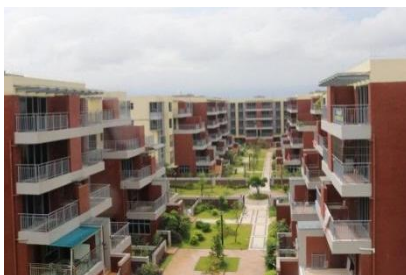
阳西员工专属特惠福利房